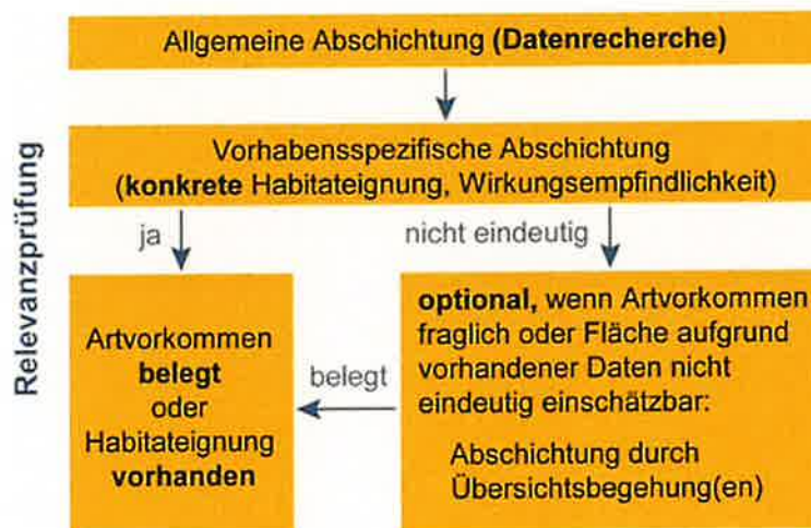
Abb. 1: Ablaufschema zur Artabschichtung (LfU 2020)

In einem ersten Schritt werden die Arten „abgeschichtet“, für die eine Betroffenheit durch das jeweilige Projekt aufgrund vorliegender Daten mit hinreichender Sicherheit ausgeschlossen werden kann. Nur für die in dieser Vorprüfung nicht ausgeschiedenen Arten ist dann die Bestandserfassung am Eingriffsort sowie die Prüfung der Verbotsstatbestände erforderlich (s. Abb. 1).