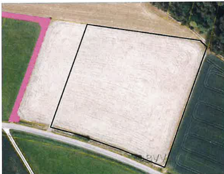
Abb. 3: Biotop westlich Planungsgebiet „Solarpark Pessenburgheim Igl“

Westlich des Planungsgebietes ist in der amtlichen Biotopkartierung an einem Graben Röhricht kartiert (s. Abbildung 3, Biotop Nr. 7331-1046-001).