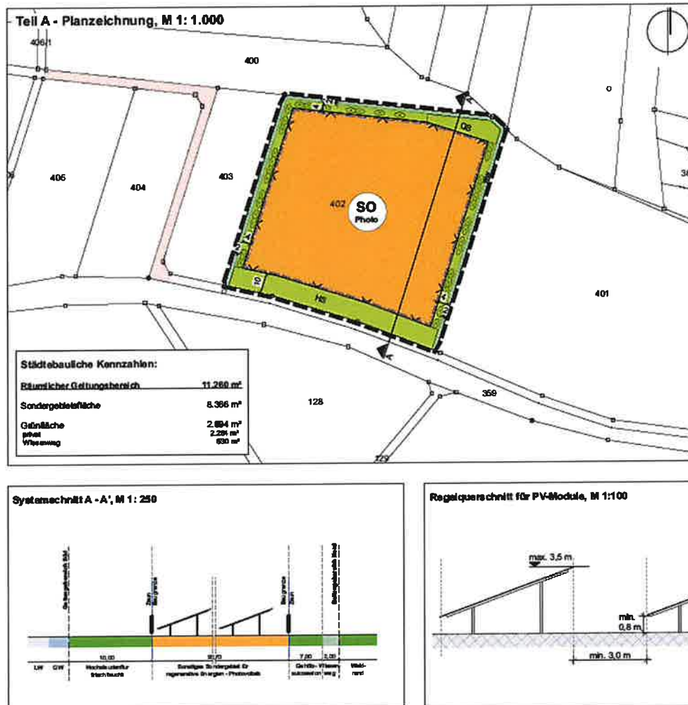
Abb. 5: Ausschnitt Planzeichnung B-Plan „Solarpark Pessenburgheim Igl“ (becker + haindl, Vorentwurf 07.02.2023)

Auf einer Ackerfläche östlich von Pessenburgheim soll eine Freiflächen-Photovoltaikanlage mit einer Fläche von 0,89 ha errichtet werden (s. Abbildung 5).