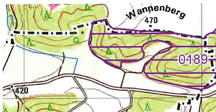
Abb. 4: Auszug ASK TK 7133 (LfU 2023)

Für das Planungsgebiet und dessen Umfeld ist in der Artenschutzkartierung (ASK) ein Eintrag über Vorkommen der Gebänderten Prachtlibelle ( Calopteryx splendens ) verzeichnet (s. Abbildung 4, 0189).