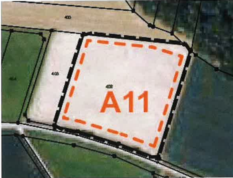
Abb. 2: Übersicht Planungsgebiet „Solarpark Pessenburgheim Igl“

Auf einer Ackerfläche östlich von Pessenburgheim soll eine Freiflächen-Photovoltaikanlage errichtet werden (s. Abbildung 2).