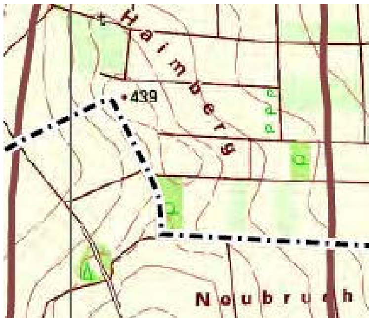
Abb. 3: Auszug ASK TK 7133 (LfU 2023)

Für das Planungsgebiet und dessen Umfeld sind in der Artenschutzkartierung (ASK) keine Einträge über Vorkommen o.g. (Arten-)Gruppen verzeichnet (s. Abbildung 3).