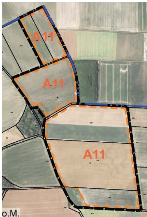
Abb. 2: Übersicht Planungsgebiet „Solarpark Pessenburgheim Greenovative 1“

Auf Ackerflächen nordwestlich von Pessenburgheim soll eine Freiflächen-Photovoltaikanlage errichtet werden (s. Abbildung 2).