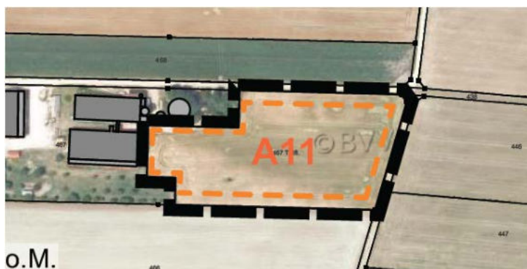
Abb. 2: Übersicht Planungsgebiet „Solarpark Pessenburgheim Raba“

Auf einer Ackerfläche nördlich von Pessenburgheim soll eine Freiflächen-Photovoltaikanlage errichtet werden (s. Abbildung 2).