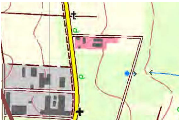
Abb. 3: Auszug ASK TK 7133 (LfU 2023)

Für das Planungsgebiet und dessen Umfeld sind in der Artenschutzkartierung (ASK) keine Einträge über Vorkommen o.g. (Arten-)Gruppen verzeichnet (s. Abbildung 3).