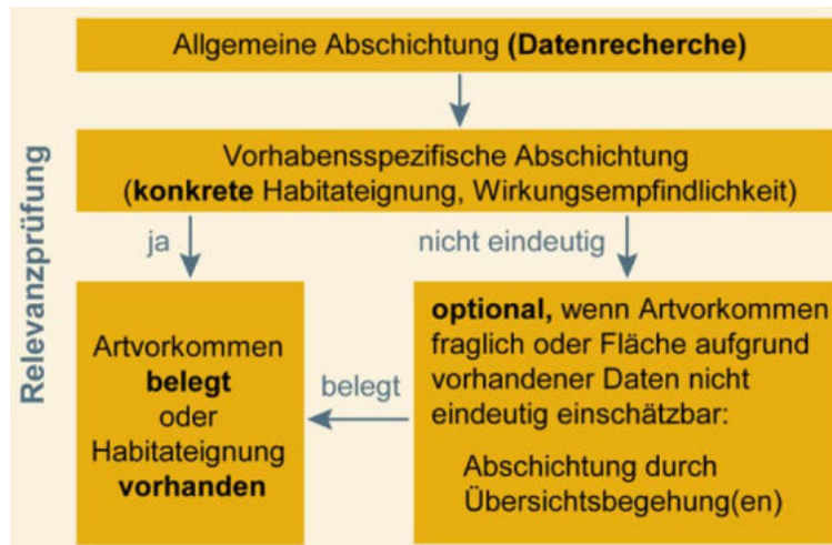
Abb. 1: Ablaufschema zur Artabschichtung (LfU 2020)

In einem ersten Schritt werden die Arten „abgeschichtet“, für die eine Betroffenheit durch das jeweilige Projekt aufgrund vorliegender Daten mit hinreichender Sicherheit ausgeschlossen werden kann. Nur für die in dieser Vorprüfung nicht ausgeschiedenen Arten ist dann die Bestandserfassung am Eingriffsort sowie die Prüfung der Verbotsatbestände erforderlich (s. Abb. 1).